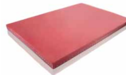
QualiFlex CrestC – Zuverlässige Leistung