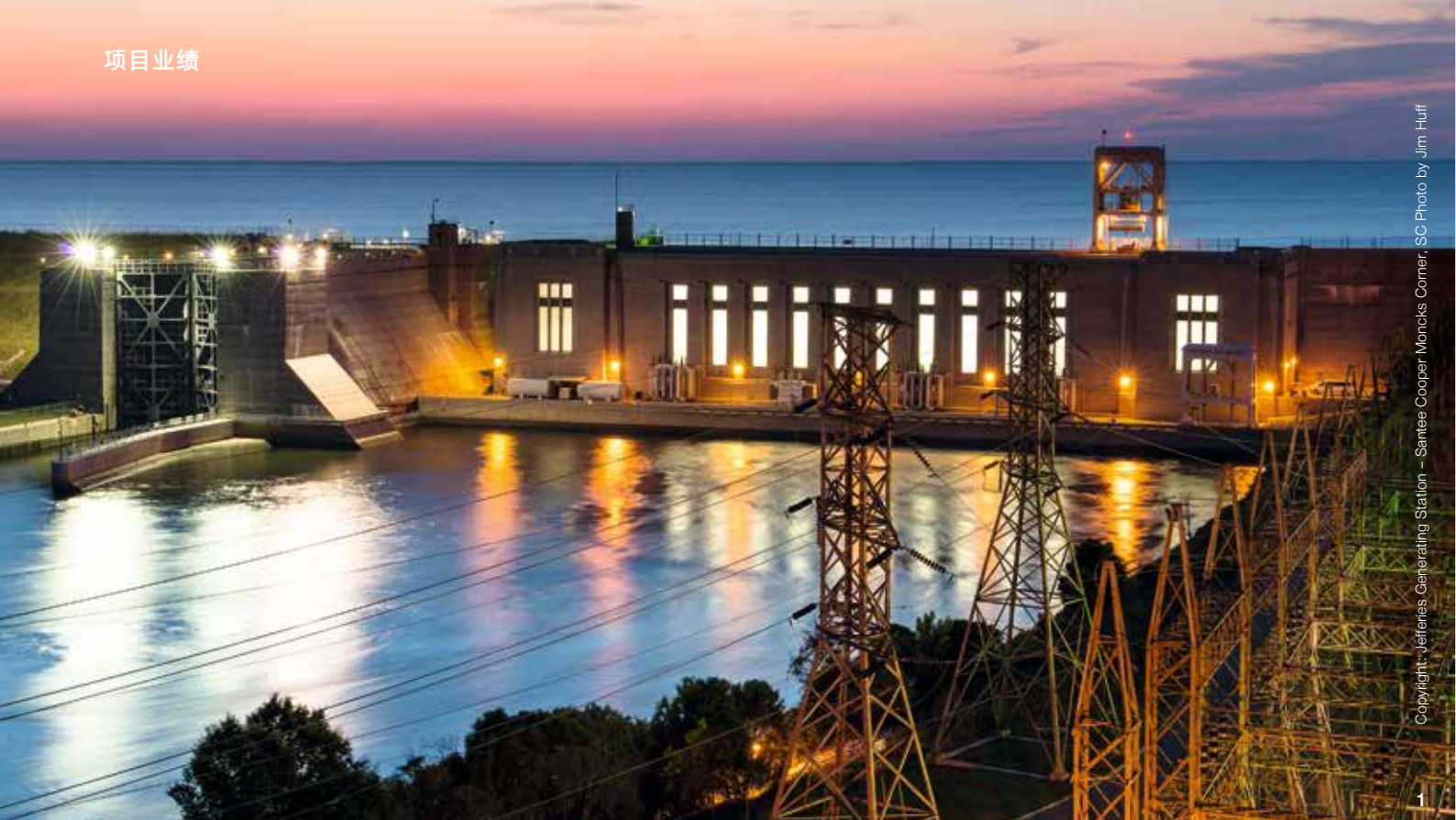
Copyright: Jefferies Generating Station - Santee Cooper Moncks Corner, SC Photo by Jim Huff