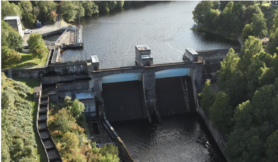
Drohnenansicht eines Wasserkraft-Staudamms