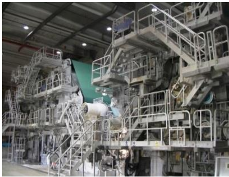
Abb. 2: Durch den Einsatz von OnEfficiency.Strength bei der PM 18 konnten im ersten Jahr 2.800 Tonnen Frischfasern eingespart werden, während wichtige Qualitätsparameter wie Biegesteifigkeit und Dicke innerhalb der Zielwerte blieben.