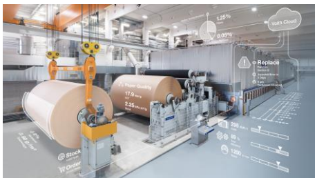
Abb. 3: Mithilfe von OnEfficiency.Strength können Qualitätsschwankungen stabilisiert und Kosten gesenkt werden.