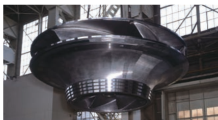
インド・ガトガール揚水発電所向 ランナー Runner for Ghatghar pumped storage plant, India

Since 1997, Voith Fuji Hydro K.K. in Kawasaki has been providing most advanced hydropower equipment for Japan and Southeast Asia as a joint venture company of Voith Hydro Holding GmbH & Co. KG and Fuji Electric Co., Ltd. As a full-line supplier, Voith Fuji offers sophisticated solutions along the entire value and supply chain: we develop, design, manufacture and deliver electrical and mechanical hydropower equipment. Moreover, we manage the complete plant engineering, commissioning and offer engineering services. Within the range of our activities, we also modernize hydropower plants of various sizes, including pumped storage plants.