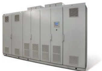
制御装置 ( Hy-CON システム ) Hy-CON series automation system

We offer generator solutions for wide range of speeds, cooling methods such as air cooling・water cooling and both horizontal and vertical shaft design. Our generators are applied with Vacuum Pressure Impregnation (VPI), an insulation method for stator coils, which is based on our state-of-art design technologies. The Rated voltages can be applied up to 23 kV, which is applicable also for large capacity generator-motors. We also offer peripheral equipment such as exciters, static frequency converters (SFC) etc.