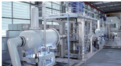
ドイツ・ハイデンハイムの流体力学研究開発施設 Hydraulic laboratory, Heidenheim Germany