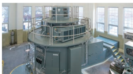
馬道発電所向 発電機 Generator for Umamichi Hydro Power Station