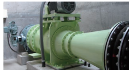
マイクロチューブラ水車発電機 Micro-Tubular Hydro Turbine and Generator