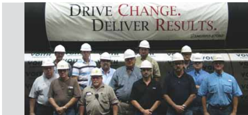
Abb. 3: Smurfit-Stone Hodge – TRM-Team.

Die Total Roll Management-Plattform von Voith basiert auf drei entscheidenden Eckpfeilern: