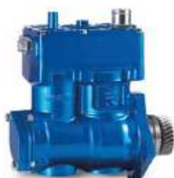
LP 490 MB OM 457 e 906