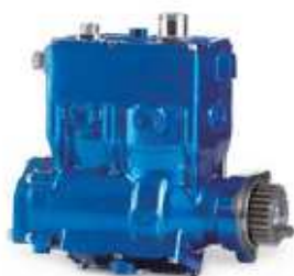
LP 490 MAN D08