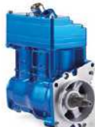
LP 490 MB 931/471