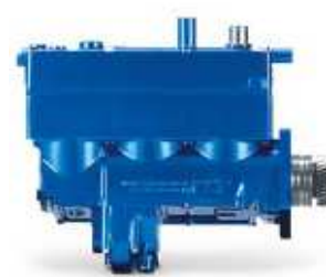
LP 700 MB OM 457 (articolato)